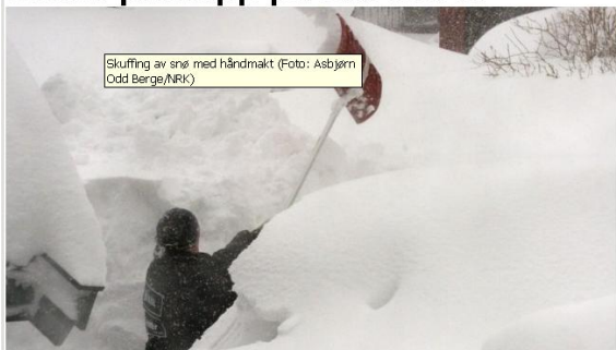
Skuffing av snø med håndmakt

Snøværet den siste uken skal få en prislapp. Det forskes på hva ekstremvær koster samfunnet.