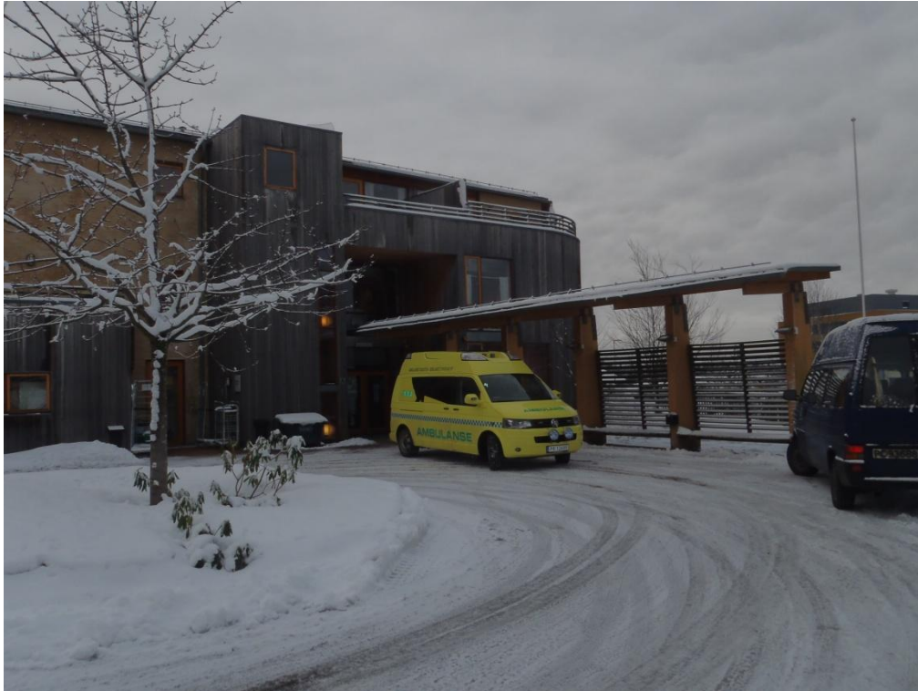
Inngangspartiet til KØH ved Myratunet i Arendal.

Det tette samarbeidet med sykehuset la grunnlag for en hospitantordning ved sykehusets akuttmottak i Arendal for nytilsatte sykepleiere i KØH og sykepleiere fra kommunenes hjemmetjenester. Dette ga stort læringsutbytte både for de deltakende sykepleiere og for sykehuset. Som tidligere nevnt ble kompetanseprosjektet i samarbeid med KS videreført i 2013.