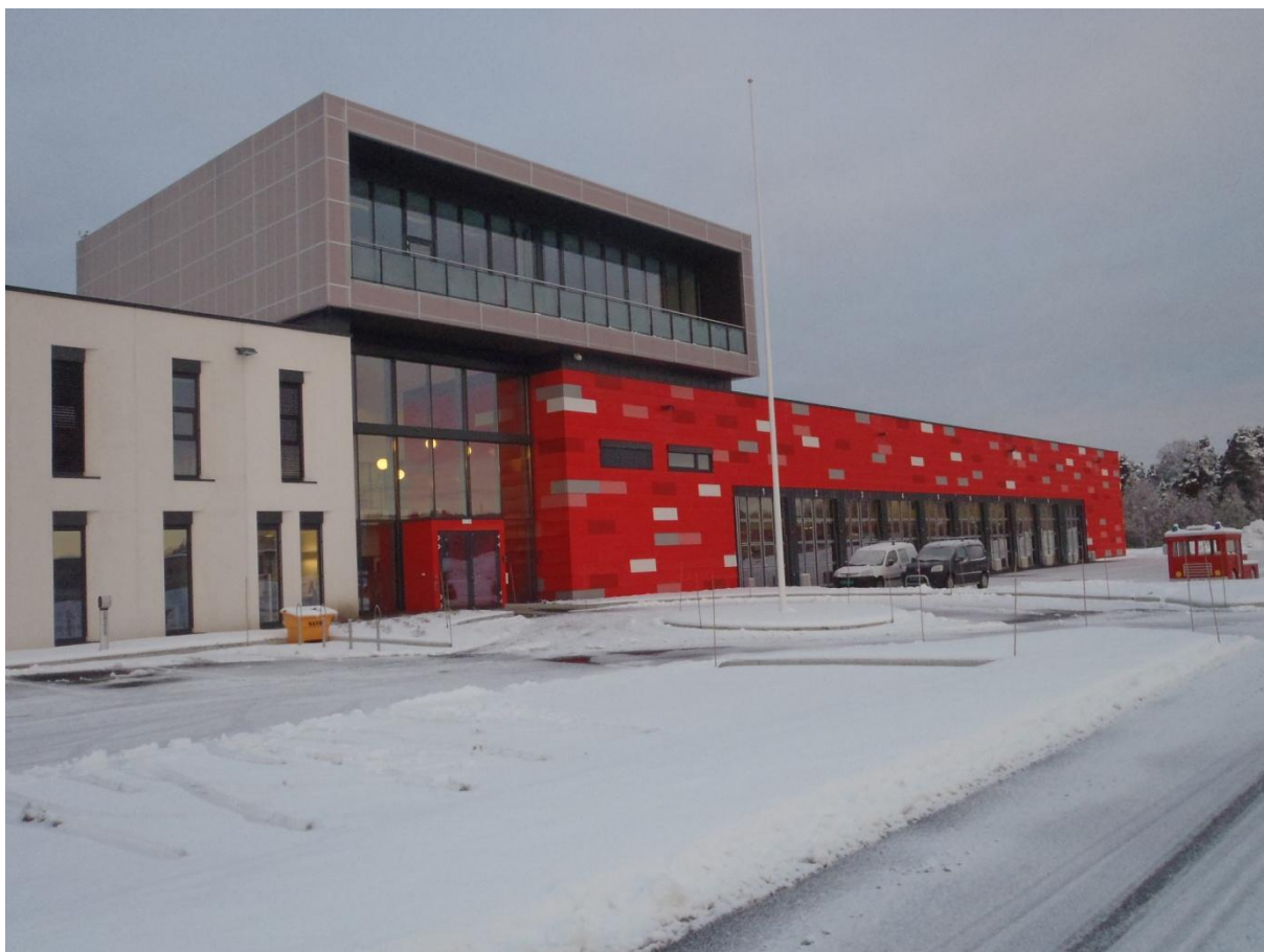
Ny brannstasjon og 110-sentral på Stoa

Styret drøftet underskuddet på lærlingplasser i regionen. Det ble vedtatt å gjennomføre en undersøkelse av omfanget på kommunale og fylkeskommunale lærlingplasser i regionen. I samråd med fylkeskommunen ble det utarbeidet et spørreskjema. Dette ble distribuert til medlemskommunene og fylkeskommunen, men responsen ble svært mangelfull. Sekretariatet vil gjøre ett nytt forsøk på å få inn denne kunnskapen. Saken er svært aktuell da det rapporteres om stor mangel på lærlingplasser for de som er ferdig med de to første årene på videregående skole. Samtidig må Østre Agder erkjenne at samarbeidet må forholde seg til at svært mange av de deltakende kommuner har mindre administrativ kapasitet enn det oppgavene tilsier. Dette er langt fra det eneste eksempel på at enkeltkommuner ikke evner å følge opp felles initiativ. Vi har opplevd tendenser til det samme under oppfølging av felles innsats for å ta i bruk velferdsteknologi.