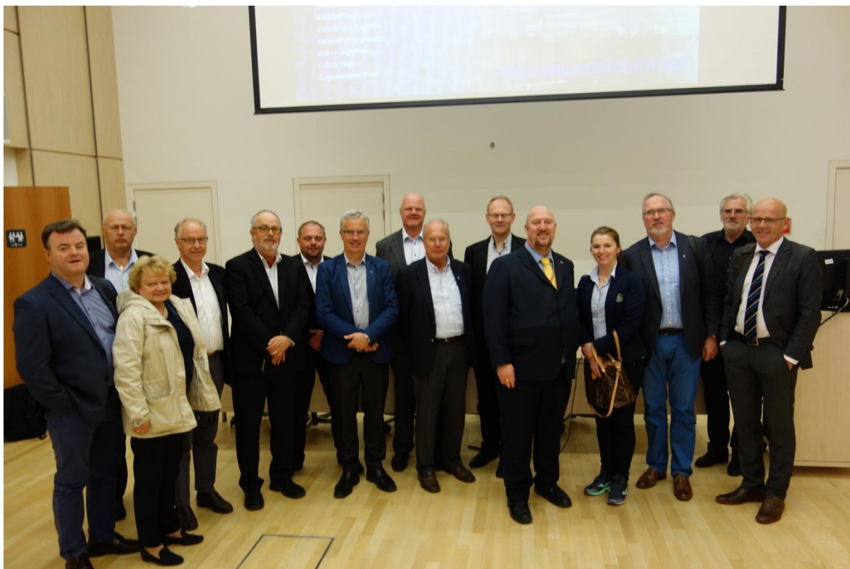
Styret og rådmennene under besøket til Committee of the Regions – The EU`s Assembly of Regional and Local Representatives i Brussel.